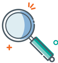
Find & Prioritize

Microsoft Teams, SharePoint Online, OneDrive for Business, Office 365 Groups 을 대상으로 모든 사용자의 권한정보, 활동기록, 민감정보를 스캔하여,