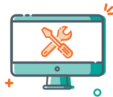
Monitor & Fix