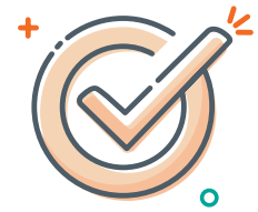
Enforce & Prevent