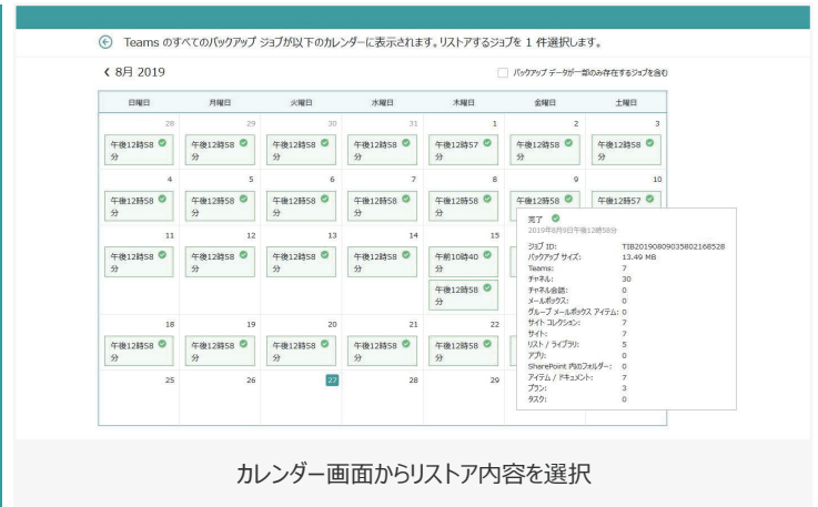
カレンダー画面からリストア内容を選択