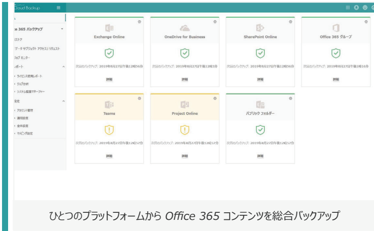
ひとつのプラットフォームから Office 365 コンテンツを総合バックアップ