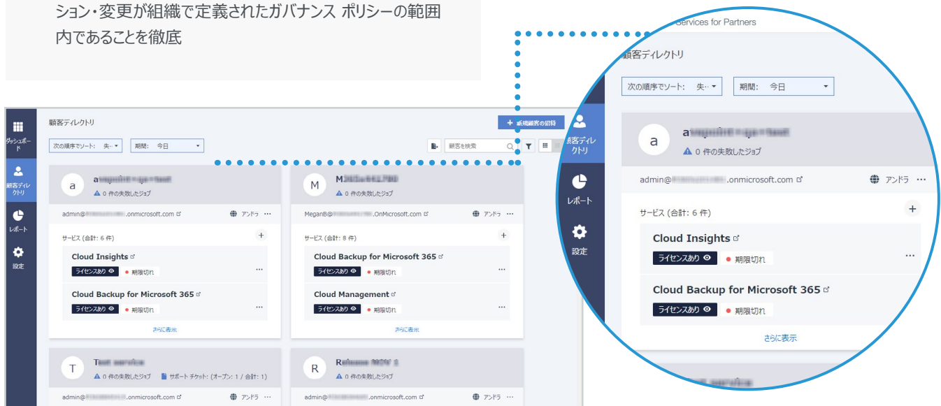
AvePoint Online Services のパートナー ダッシュボード画面

「AvePoint Online Services によって管理される ServicePoint365 や Microsoft 365 といったクラウド ベースのコラボレーション テクノロジーの登場により、データへの確実なアクセス、そして効率の良いワークスタイルの両立が実現しました。これは、顧客にとってとても大きな利益です。」