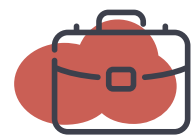
Microsoft 365 管理

一元管理画面で顧客の Microsoft 365 環境を管理・再構築・レポート化します。