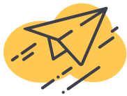
Microsoft 365 移行

AvePoint Online Services の強力な機能を援用して、Microsoft 365 のマネージド サービスを拡大し、差別化を図ることができます。