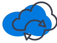
Microsoft 365 バックアップ

ファイル サーバー・Exchange・G-Suite メールボックス・SharePoint・Dropbox をはじめとする多様なコンテンツを Microsoft 365 に移行します。